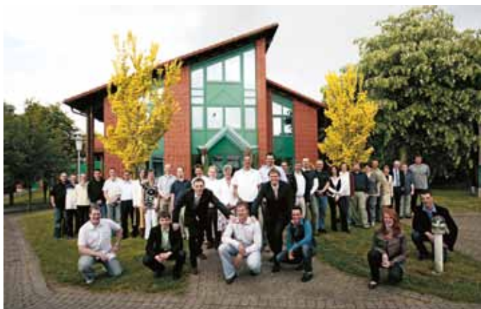
Alle auf einen Streich: die TimberTec-Mannschaft vor ihrem neuen Domizil in Eutin/DE

Doch erstmal wird gefeiert: Am 5. Oktober in einem im Mai 2008 neu bezogenen, eigenen Domizil mit 1800 m 2 Büro- und Nutzfläche stehen die Türen für Kunden, Freunde und Gäste offen. SP